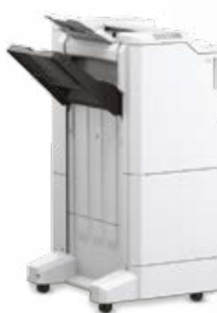
Stapel-/Heft- einheit für 4.000 Blatt (Brückeneinheit erforderlich)