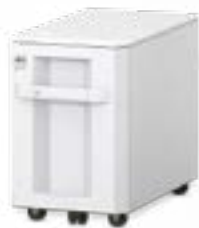
Große Papierkassette für 3.000 Blatt