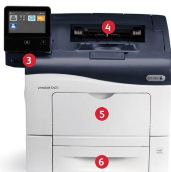
Xerox® VersaLink® C400 Farbdrucker Drucken.