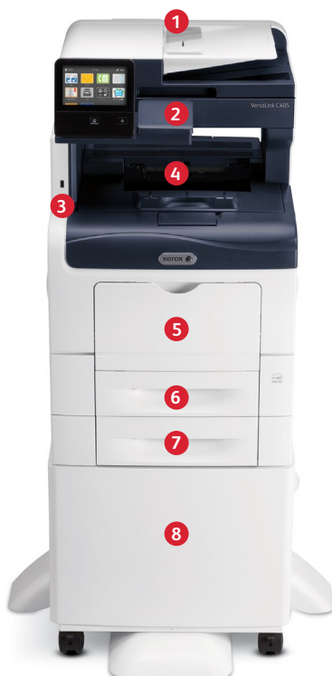
Xerox® VersaLink® C405 Farb-Multifunktionsdrucker Drucken. Kopieren. Scannen. Faxen. E-Mail.