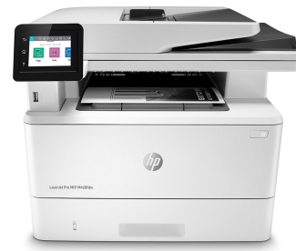
HP LaserJet Pro MFP M428fdw

Dynamic-Security-fähiger Drucker. Ausschließlich für die Verwendung mit Patronen mit Original HP Chip vorgesehen. Patronen mit Chips anderer Hersteller funktionieren möglicherweise nicht oder in Zukunft nicht mehr. Weitere Informationen unter: http://www.hp.com/go/learnaboutsupplies